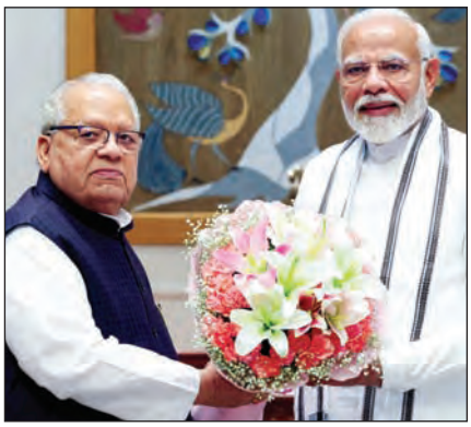
राजस्थान के राज्यपाल कलराज मिश्र ने प्रधान मंत्री नरेन्द्र मोदी से मुलाकात की।