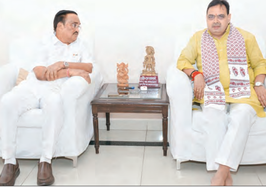
राजस्थान के मुख्यमंत्री ने नई दिल्ली में केंद्रीय जल शक्ति मंत्री से की मुलाकात।

व महत्व को विभिन्न कलात्मक प्रस्तुतियों के जरिए दर्शाया जाएगा। देश-विदेश से अतिथियों का होगा कार्यक्रम में आगमन: माना जा रहा है कि कार्यक्रम में शिरकत करने के लिए देश-विदेश से अतिथियों को आमंत्रित किया जाएगा तथा उनके सम्मान में डिनर का भी आयोजन किया जाएगा। उल्लेखनीय है कि 'द बोधि यात्रा' कार्यक्रम के दौरान इंटीरेक्टिव व क्लचरल रेशन का आयोजन किया जाएगा। कार्यक्रम का आयोजन नई दिल्ली के 5 सितारा होटल में किया जाएगा जिसका जल्द ही निर्धारण हो जाएगा। माना जा रहा है कि कार्यक्रम में 400 से ज्यादा विजिटर्स भाग ले सकते हैं और इसी अनुरूप उत्तर प्रदेश पर्यटन विभाग कार्यक्रम के दृष्टिगत अपनी तैयारियों को अमलोजामा पहनाने की दिशा में कार्यरत है।